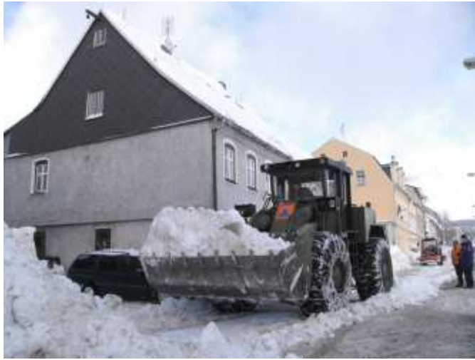
03. - Asistence při provalené střeše v ulici Hamerská 29, zajištěna objízdná trasa ulic Nádražní a Jiráskova, pomoc při vyprošťování vozidel